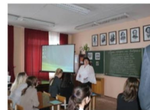
3 кабинета литературы