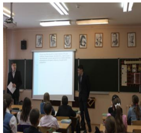
3 кабинета математики