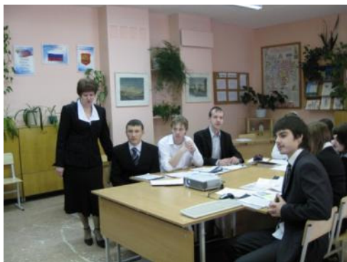
2 кабинета истории