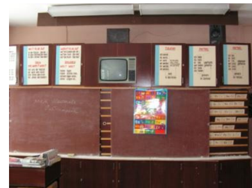
3 кабинета иностранного языка