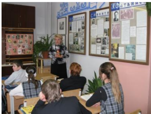
кабинет литературного краеведения