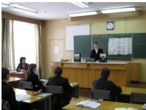
2 кабинета физики