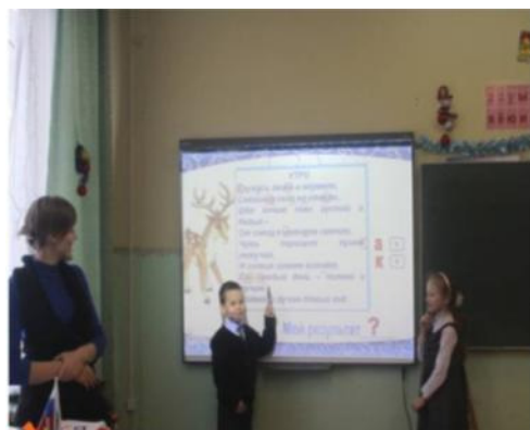
кабинеты начальной школы