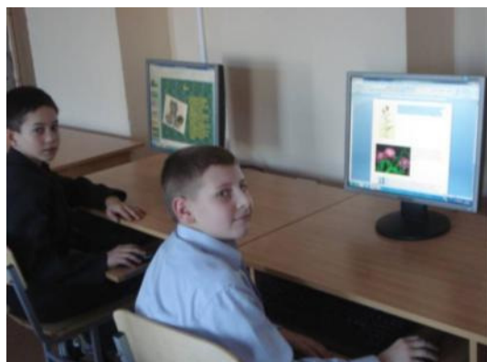
3 кабинета информатики