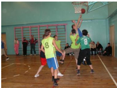
2 спортивных зала